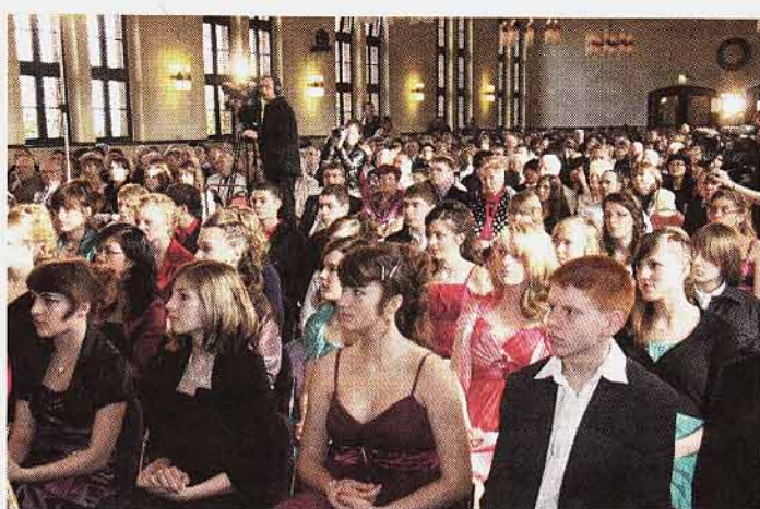
Alle Plätze im Saal waren gefüllt.